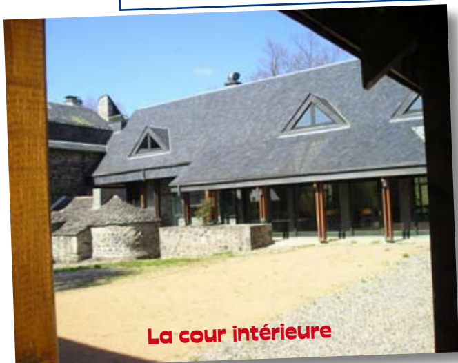
La cour intérieure