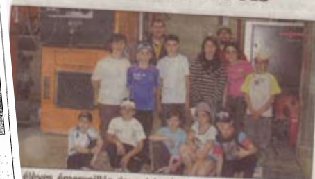
Des élèves émerveillés devant les immenses chaudières à bois

Le centre « Temps jeunes » Arinthod a rouvert ses portes au château de Vogna la saison 2010, sous la direction de M. Bigre. La classe « bois EEDD », créée en 2006 par les animateurs, voit sa finalité atteinte avec la visite jeudi de la chaufferie bois à Arinthod. Cette dernière a permis aux élèves de voir concrètement ce que veut dire développement durable. Le centre reçoit cette année quatre classes sur ce thème, dont les classes de Clis/CM1-CM2, de l'école de Pont-de-Clais (Isère).